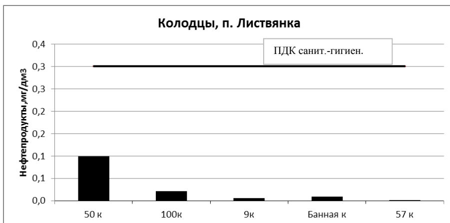
Рис. 2. Содержание ( \text{мг/дм}^3 ) нефтепродуктов в воде колодцев пос. Листвянка

В октябре 2014 г. объектом исследования также были пробы воды из колодцев, расположенных в частном секторе пос. Листвянка (рис. 2), который представляет собой несколько падей. Для анализа были отобраны пробы колодезной воды из таких падей, как Сеннушка, Малая Черемшанка, Черемшанка, Банная. Глубина колодцев в этих падах составляет от 5 до 15 м. Согласно [10], органолептические свойства колодезной воды падей соответствуют предъявляемым к подземной воде требованиям. Концентрации нефтепродуктов в проанализированных пробах не превышают ПДК для водоемов общесанитарного пользования ( 3 \text{ мг/дм}^3 ) [8].