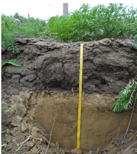
Рис. 2. Почвенный разрез на точке 1. Граница между гумусовым и глинистым горизонтами под пашней