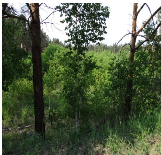
Рис. 3. Точка 2. Сосновый с березой лес над почвенным разрезом

Затем путь проходил на север к песчаному карьеру – точка 7, где отмечено залегание серых лесных почв с небольшим гумусовым горизонтом, но с большим иллювиальным осветленным горизонтом песка.