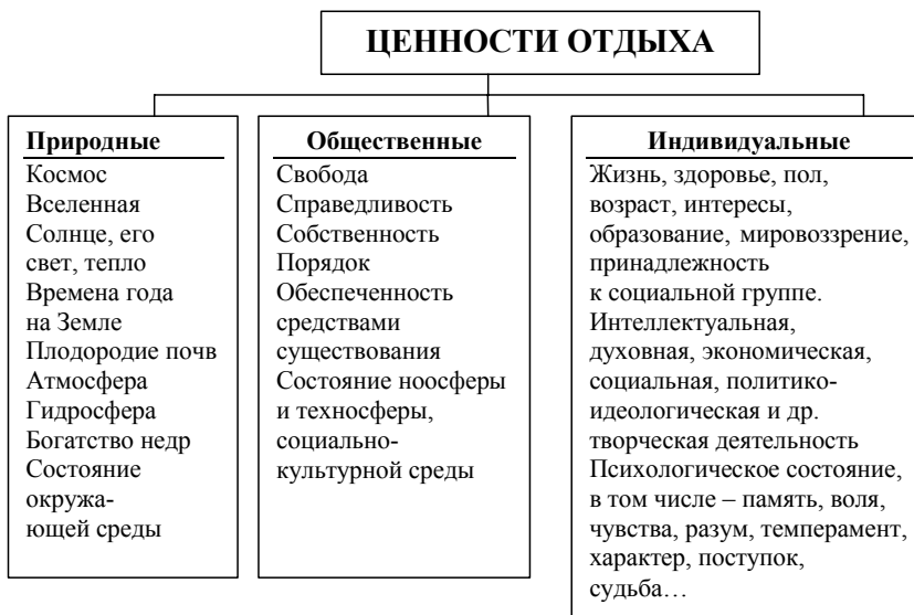
Рис. 2. Классификация ценностей отдыха

В обществе, являющемся неоднородным по классовым или иным общественно-групповым признакам, всегда находятся критерии справедливости и несправедливости в потреблении отдыха. В этой связи актуальным является вопрос рассмотрения ценностей отдыха в социуме и природе. Ценности отдыха можно классифицировать как природные, общественные и индивидуальные (рис. 2). Несбалансированность ценностных межсубъектных отношений отдыха представляет собой источник и основу отчуждения между людьми, от самого себя, от общества и природы.