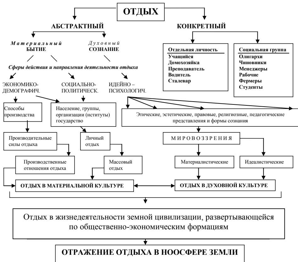
Рис. 1. Структура социальных отношений отдыха

Социальную структуру (состав) отдыха составляют общественные отношения (связи), определяющие функционирование отдельных сфер или институтов жизнедеятельности общества. При этом экономико-демографическая, социально-политическая, идейно-психологическая, культурная и другие структуры общества рассматриваются как отдельные аспекты его социальных связей.