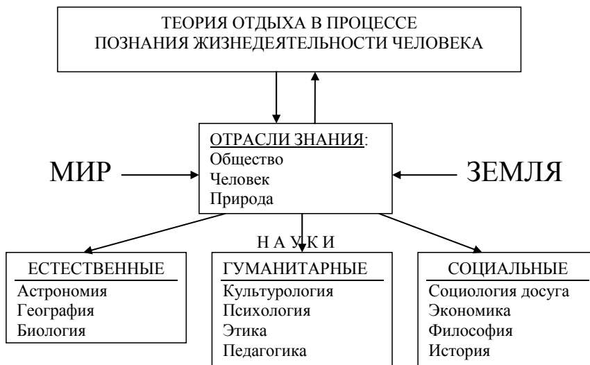
Рис. 3. Место теории отдыха в системе наук

С точки зрения этих наук многие понятия теории отдыха отражаются в следующих общенаучных направлениях: демографическом (медицинские, гендерные, рекреологические исследования); экономическом (создание необходимых хозяйственно-экономических условий для отдыха, материально-техническая база отдыха: размещение, транспорт, питание, развлечения; товары для отдыха; рекламно-информационное обеспечение отдыха); социально-политическом (социологический, исторический, политологический, культурологический аспекты отдыха, правоведческое и журналистское его обеспечение); отражение отдыха в общественном сознании (эстетика, этика, педагогика, теология, лингвистика); инженерно-техническом (архитектура и дизайн, строительство, ЖКХ); естественно-научном (на стыке проблем взаимодействия общества и природы) в географии, геологии, метеорологии, гидрологии, экологии, биологии, космогонии, астрономии и других.