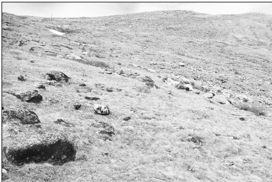
Рис. 2. Высокогорная каменистая дриадовая тундровая группа фаций (Восточный Саян)

луговых почвах. Подгольцовый пояс представлен ерниками, зарослями ивовых кустарничков, кашкарниками и кедровым стлаником. Кедровый стланик располагается как на водоразделах, так и на склонах различной крутизны.