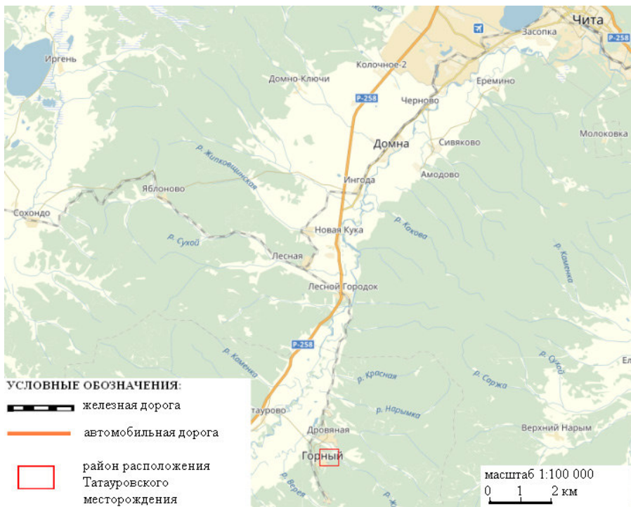
Рис. 1. Схема географического положения месторождения