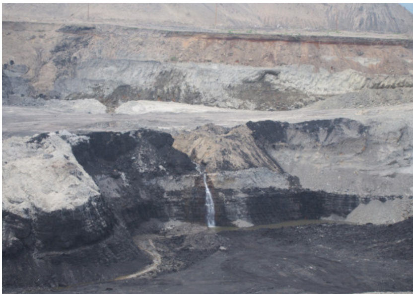
Рис. 4. Один из увлажненных бортов карьера на Татауровском буровугольном месторождении (на заднем плане отвалы вскрышных пород)

Для обеспечения устойчивости отвалов были предложены мероприятия по упорядочению карьерного водоотлива и приняты параметры внутренних отвалов (табл. 2).