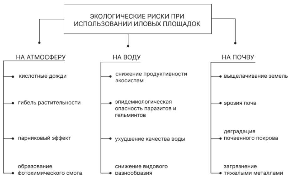
Рис. 1. Анализ экологических рисков при использовании иловых площадок

Осадки сточных вод могут оказаться значительным экологическим риском для окружающей среды, если не принимать меры по их утилизации и обработке. Поэтому необходимо внедрение современных технологий и оборудования для эффективной обработки сточных вод, чтобы уменьшить негативное воздействие на окружающую среду и здоровье людей.