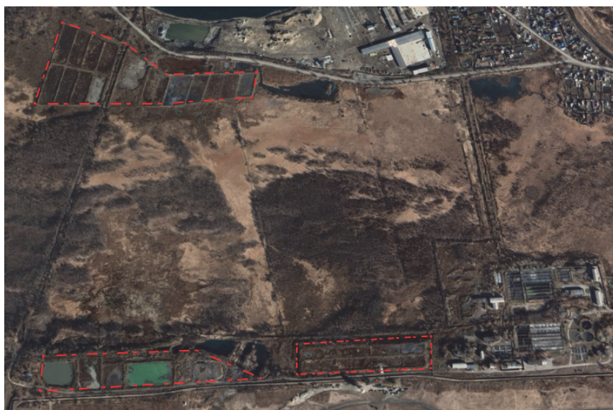
Иловые площадки КОС левого берега г. Иркутска

В настоящее время на КОС г. Иркутска эксплуатируется 52 иловых площадки (рис. 3, 4) (27 на КОС левого берега и 25 на КОС правого берега) на естественном основании с поверхностным удалением воды и шесть иловых площадок каскадного типа (на КОС правого берега).