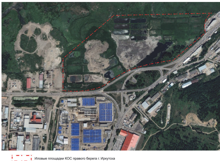
Рис. 4. Расположение иловых площадок КОС правого берега г. Иркутска

Подсушка осадка на иловых площадках осуществляется за счет фильтрации иловой воды через основание карт и естественного испарения воды. Улучшению водоотдающих свойств способствуют также зимнее промерзание и весеннее оттаивание осадка.