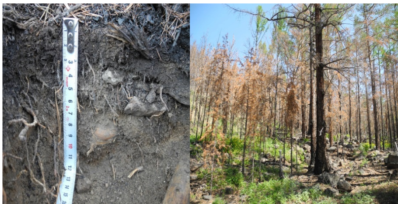
Рис. 3. Дерново-подзолистая пирогенная почва

На территории исследования встречаются большие площади сгоревшего леса, в особенности в долинах горных рек и на склонах, обращенных к оз. Байкал. На местах пожаров, в особенности верховых, часто образуются ветровалы, и, как следствие, на таких территориях усиливаются эрозионные процессы почв (рис. 4).