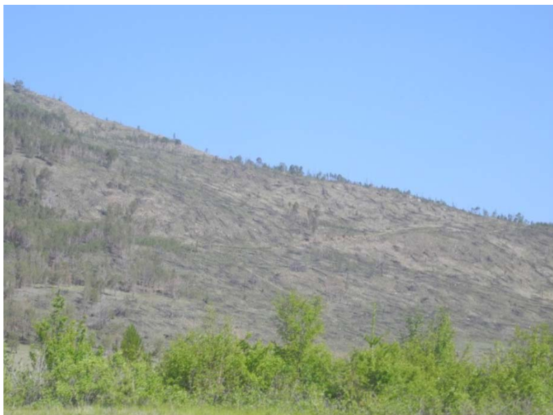
Рис. 4. Ветровал после пожара на одном из склонов Приморского хребта