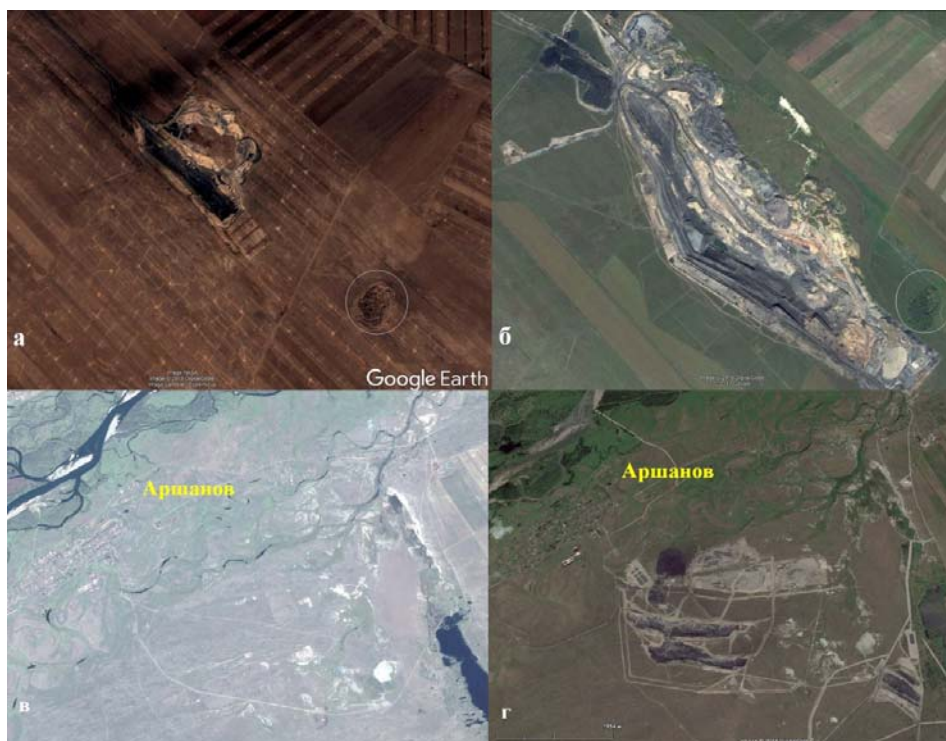
Рис. 2. Изменение размеров участков угольной промышленности Бейского месторождения. Восточно-Бейский разрез: а – 2001 г., б – 2018 г.; Аршановский разрез: в – 2013 г., г – 2018 г.

товительные работы на котором начались в 2018 г. В конце марта 2019 г. было подписано соглашение о сотрудничестве в реализации инвестиционного проекта «Освоение Бейского каменноугольного месторождения, в том числе первоочередных участков Юго-Восточный Кирбинский и Северо-Западный Кирбинский».