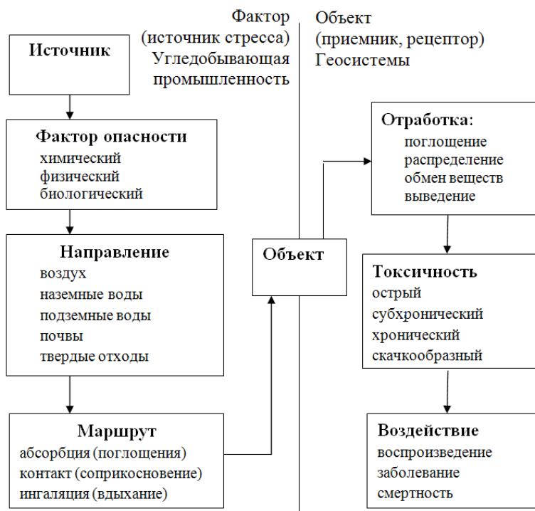
Рис. 3. Структура оценки экологического риска [Planning an Ecological ... , 2012]

охране окружающей среды США [Planning an Ecological..., 2019] была разработана схема планирования экологического риска, определяющая последовательность оценки воздействия факторов на рецепторы и виды ответных реакций (рис. 3). На наш взгляд, данная схема должна быть дополнена еще одним компонентом, «географическим», который включает в себя в том числе климатические, геоморфологические, гидрологические, биологические и другие условия, позволяющие учитывать и местную специфику.