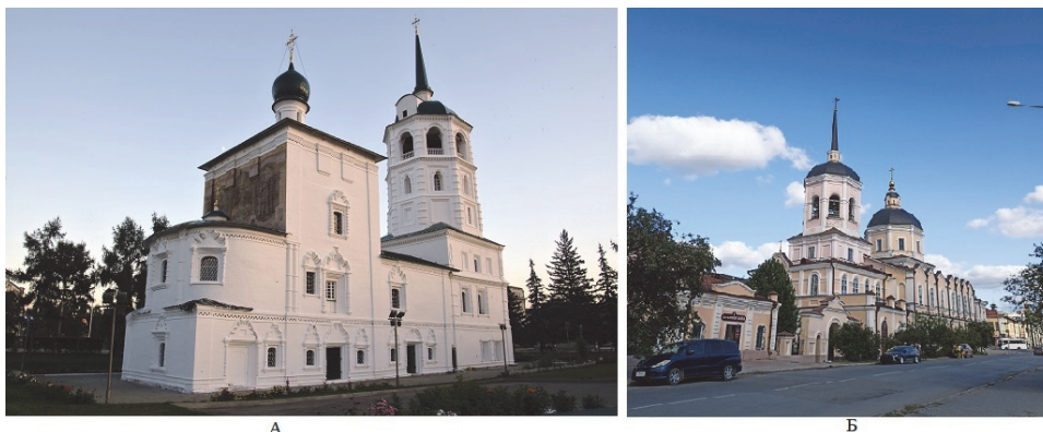
Рис. 3. Православные храмы: а – Спасская церковь, г. Иркутск; б – Богоявленский Кафедральный собор, г. Томск

Сказались статус и роль в церковной жизни изучаемых городов (см. табл. 2), поскольку решение на строительство церквей, монастырей инициируется и осуществляется по занимаемому уставному положению («конфессиональному сану»), получаемому доходу, потенциалу прихожан и соответствующим запросам на сооружение строений [Санников, 2013].