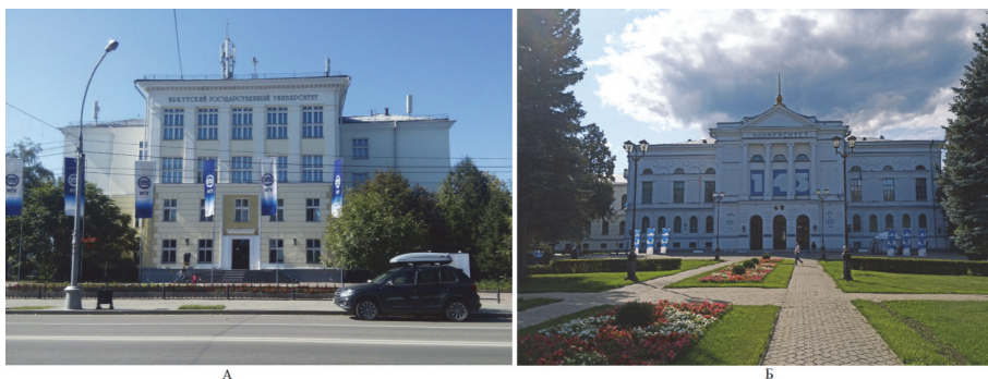
Рис. 4. Высшие учебные заведения: а – Иркутский государственный университет, б – Томский государственный университет