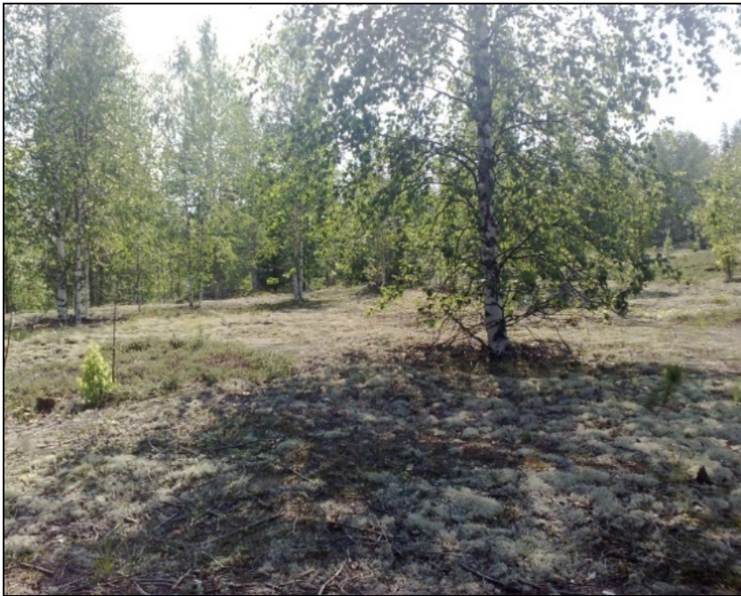
Рис. 1. Водораздел рек Лена и Турука; березняк на соленосных кембрийских отложениях

Восточнее этого района преобладают среднегорные кедровые мелко-травно-зеленомошные наветренных склонов геосистемы на дерново-подзолистых почвах и островной мерзлоте. В условиях барьерной тени в восточной части плато доминируют кедрово-лиственничные кустарничково-моховые с ерниковым подлеском на дерново-подзолистых и торфянисто-перегнойных почвах геосистемы.